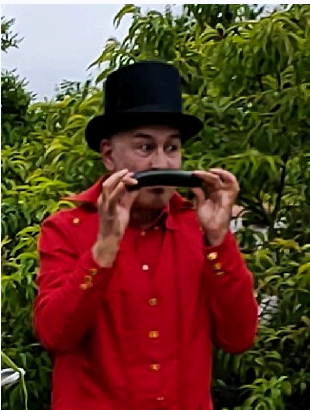
© Les Chemins Buissonniers - Jean-Michel Hernandez